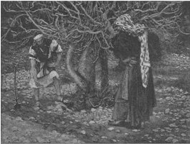
James Tissot, 1886-96